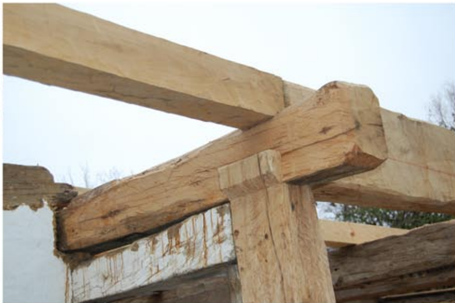
Szerkezeti elem cserék