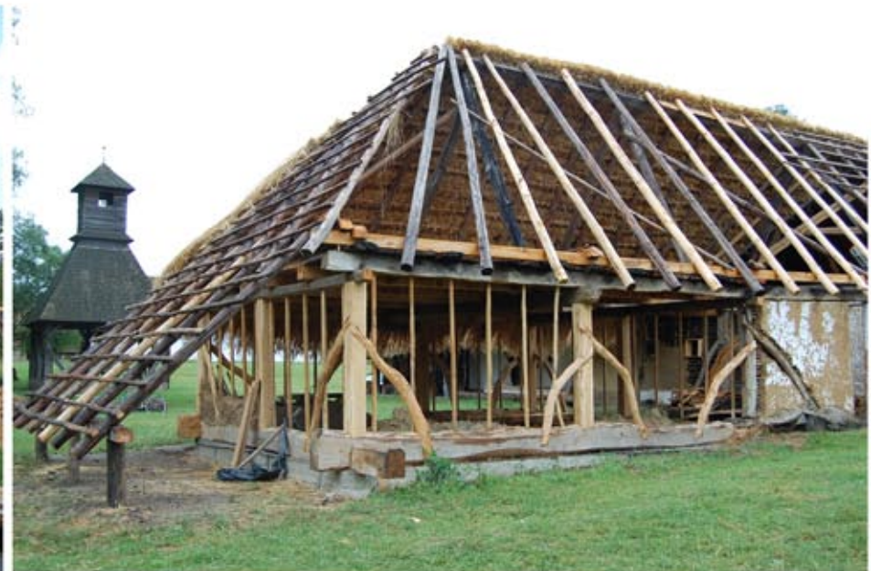
Az elkészült épületszerkezetek