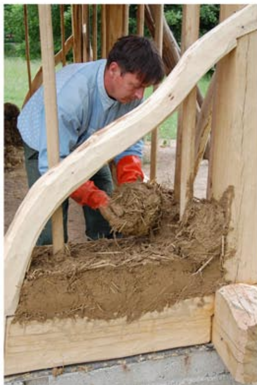
Karóközös sárfal készítése az új vázszerkezetben