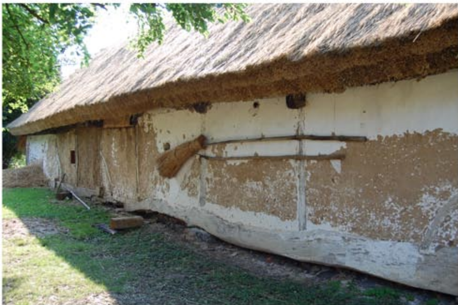
A levágott eresz