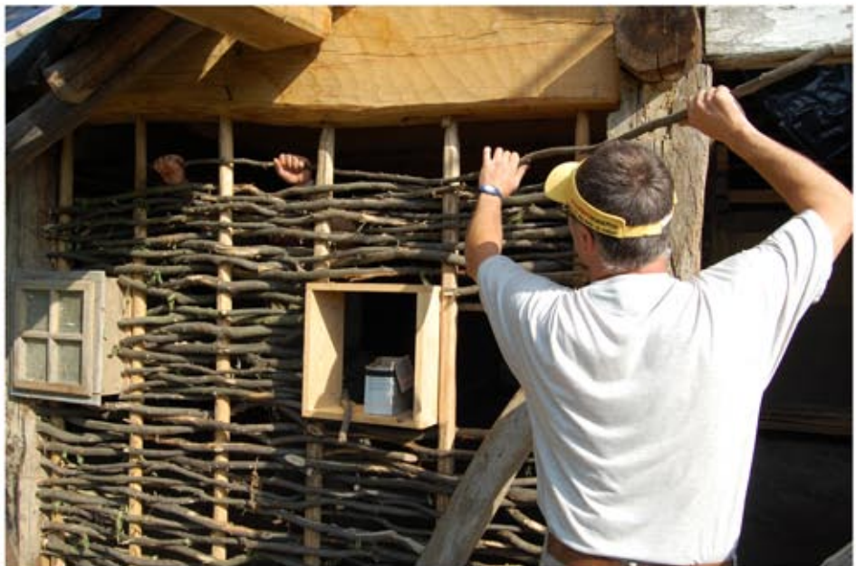
Sövényfalszakaszok fonása és újratapasztása