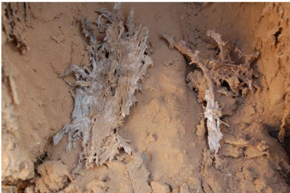
Könnyező házigomba gombafonalai, kibontott oszlopban a pajtánál.