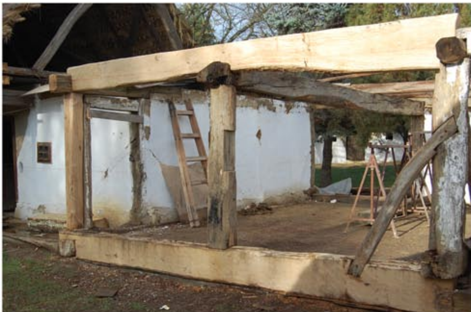
A kamra épületvázának rekonstrukciója