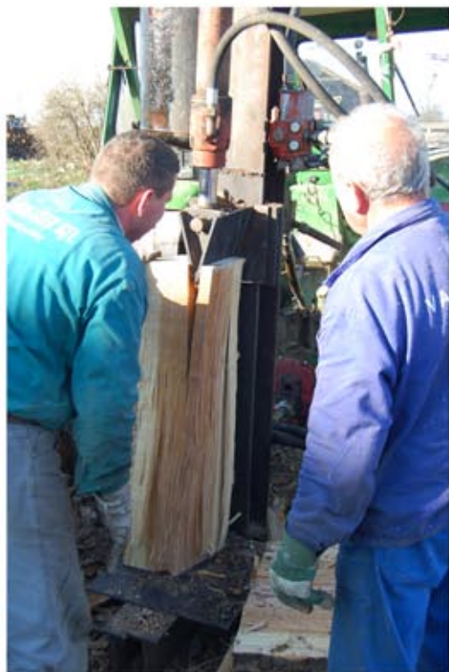
Tölgyfából hasított mennyezetelemek az istálló rekonstrukciójához