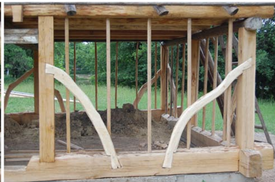
Az istálló vázszerkezetének rekonstrukciója faragott tölgyfából