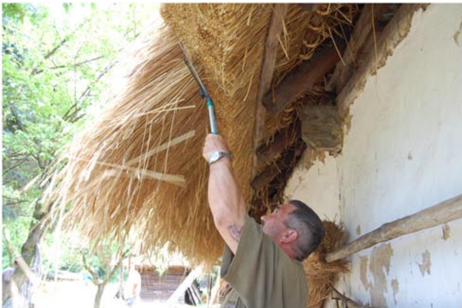
Az ereszalja levágása, a zsúp felverése