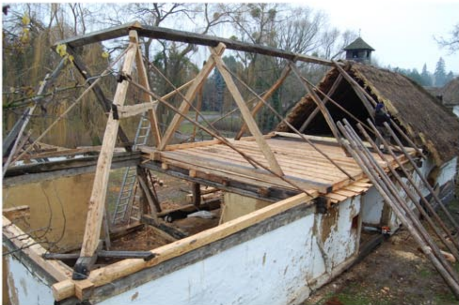
Tetőszerkezet rekonstrukciója a lakórész fölött