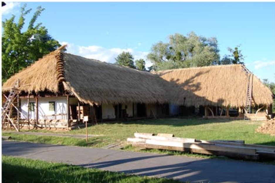
A megsúpolt épület