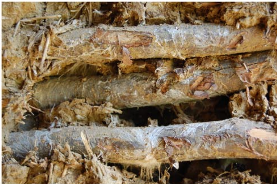
A rovar- és gombafertőzött szerkezeti részek, gombafonalak a sövényfalban.