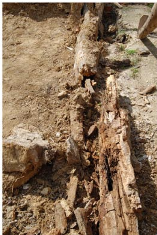
Az istálló talpgerendái és oszlopai teljesen elkorhadtak. Az épületrészt teljesen újjá kellett építeni.