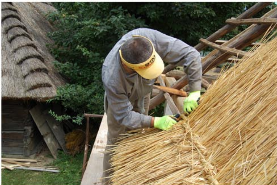
A zsúpolás megkezdése