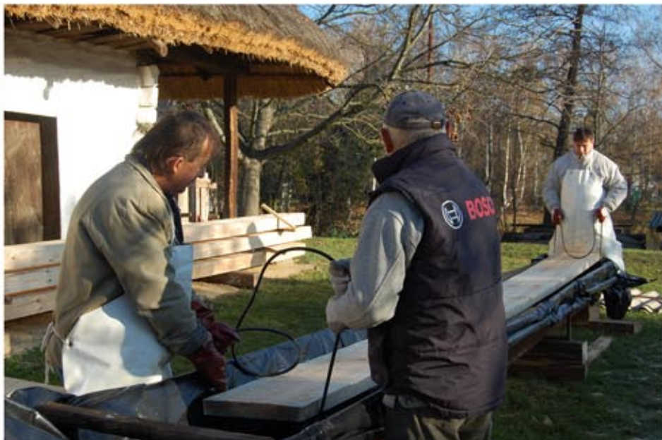
Bekerülő új anyagok faanyagvédelmi kezelése