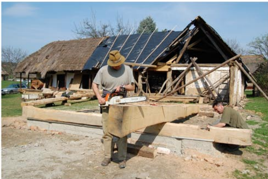
Az istálló rekonstrukciójának megkezdése, talpgerendák elhelyezése új beton alapokra