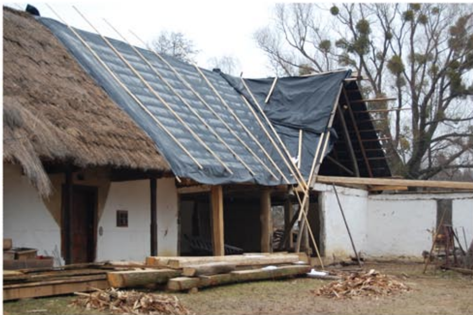
A rekonstruált tetőrész időszakos védelme