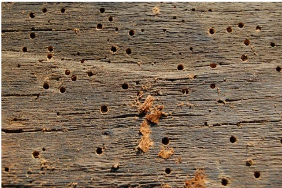
Erősen rovarfertőzött szerkezeti elemek a konyha mennyezetén